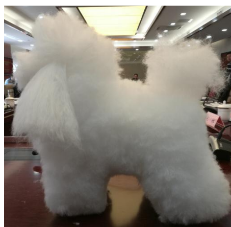
图 2 预审前的模型犬

在正式比赛前,所用器械和犬模型,需经裁判检查和确认后方可比赛。参赛选手现场选用工具为电剪、排梳、针梳、直剪。