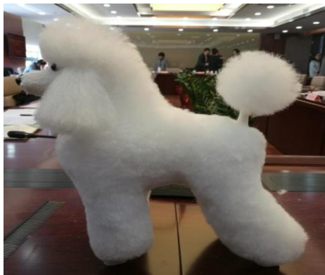
图 3 修剪完的模型犬

e. 整体：完成后整体比例、线条符合品种标准，左右对称，整体和谐平衡，安装好眼睛、鼻子和尾巴。