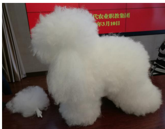
图 1 梳理后的模型犬

预审前,选手可进行初步修剪,各部分留毛长要求如下:身体外廓 5-6cm;两腿内侧剪出 1cm 空隙;额段分开,脸部和 V 领需要剃掉的部分留毛 3cm;耳朵剪掉 2cm,下腹线留 2.5-3cm;尾巴剪掉 2cm,安装好。